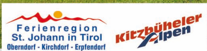
UCI Rad Masters WM

St. Johann in Tirol ist eine der veranstaltungsreichsten Regionen in Tirol. Veranstaltungen wie der Koasalauf der Langläufer, das Original Lederhosenfest, der Radwelt-pokal und die UCI Rad Masters WM, das Knödelfest mit dem längsten Knödeltisch der Welt oder das Hahnenkammrennen in Kitzbühel zählen zu den Top-Events des Jahres!