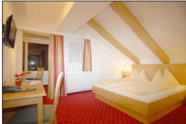
Camera: Kitzbüheler Horn