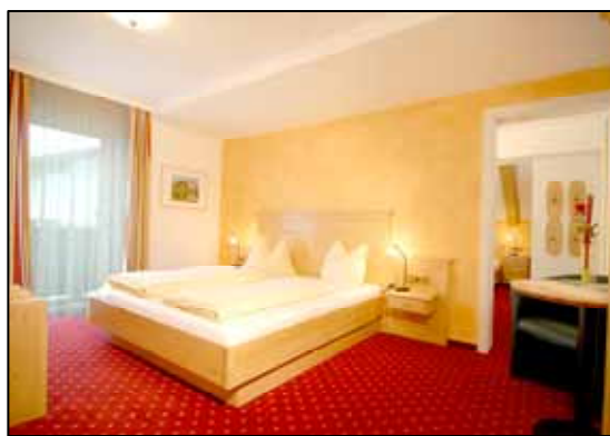
Camera: Kitzbüheler Horn