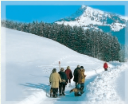
Winteridylle am Kitzbüheler Horn