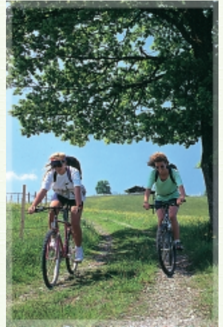
... radeln & biken ...