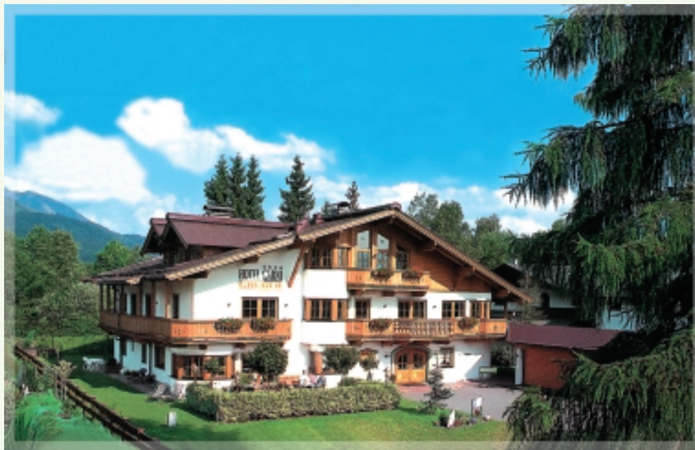
Ihr Zuhause in Tirol