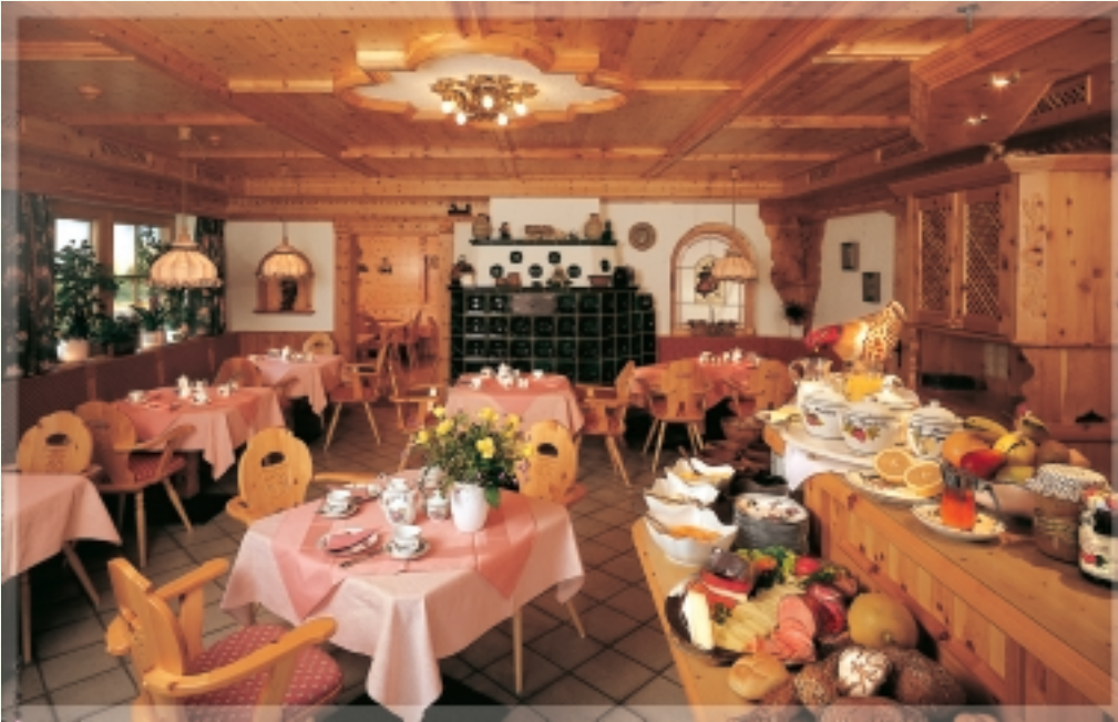
Jeder Urlaubstag beginnt mit einem ausgiebigen Frühstück

Telefon: (0) 53 52/6 14 61 · Fax: (0) 53 52/6 14 61-33 Internet: www.hotelgruber.at · E-Mail: info@hotelgruber.at