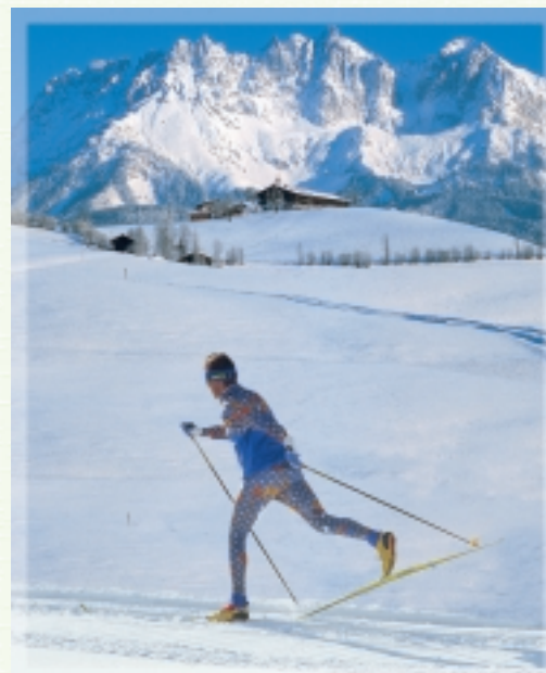
... in der Spur durch die Natur ...