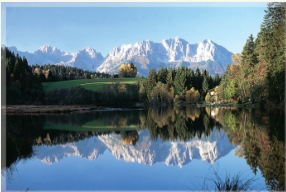
Natur pur am Wilden Kaiser