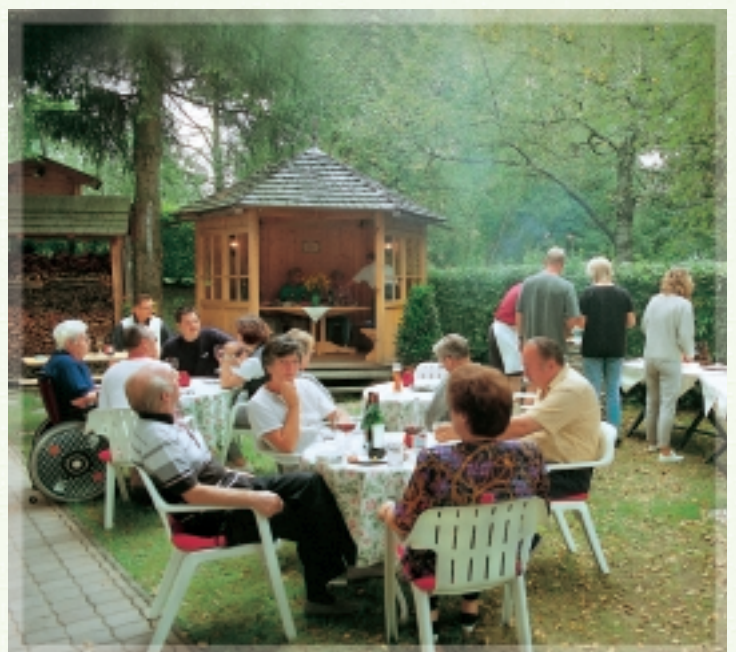
Gemeinsamer Grillspaß am Pavillon